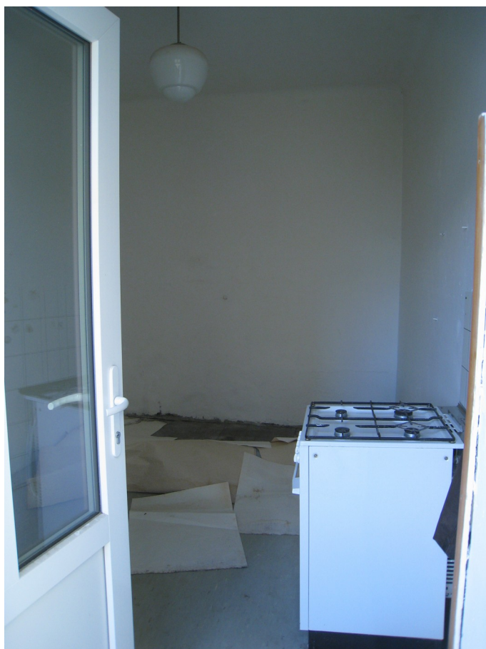
1.03 – WC (SPOLEČNÉ NA PAVLAČI)