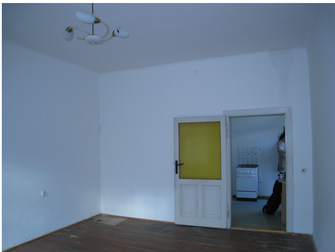
1.02 - KUCHYŇ